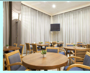
Τιμή με ημιδιατροφή