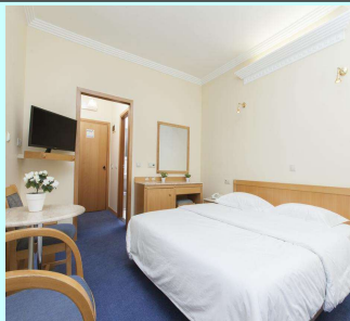
B' Cat ★★★