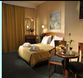
Τιμή με πρωινό 148 € (€)