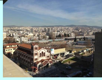
Τιμή με ημιδιατροφή 170 € (€)