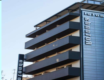
B' Cat ★★★