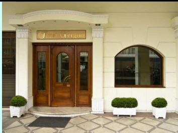
B' Cat ★★★