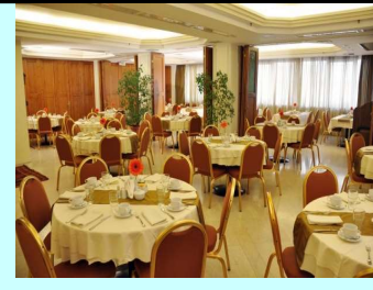
Τιμή με ημιδιατροφή 6€ ανά μαθητή ανά ημέρα