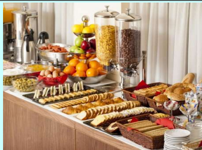
Τιμή με πρωινό 169 (€)