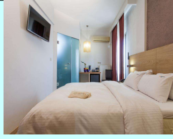
Τιμή με πρωινό 159 € (€)